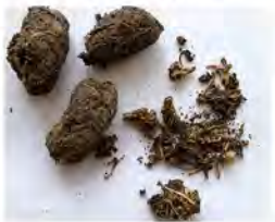
Pelotes de réjection