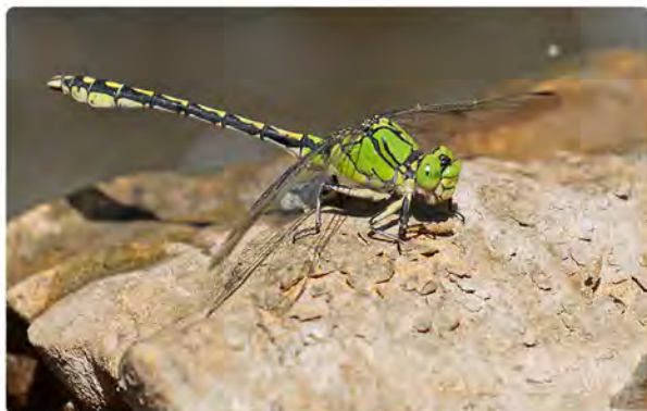
Ophiogomphus cecilia , gomphe serpentín

Les odonates bénéficient d'un Plan National d'Actions qui a pour objectifs l'évaluation et l'amélioration de l'état de conservation des espèces d'odonates menacées. Le bassin de la Loire et le fleuve Loire abritent des populations bien particulières de libellules comme le gomphe serpentín ou le gomphe à pattes jaunes, dont l'écologie est liée à la dynamique fluviale.