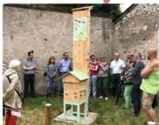
< Première récolte de miel en septembre 2023

Selon vos envies et vos disponibilités, si vous souhaitez rejoindre un groupe plein d'échanges et de convivialité, contactez-nous !