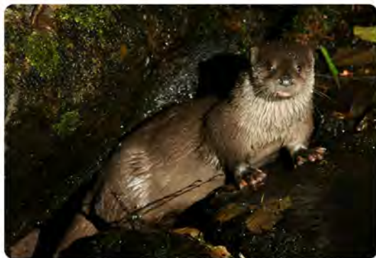
Loutre d'Europe

Venez découvrir l'histoire de cet animal fascinant, de ses causes de disparition ancienne, à sa reconquête des territoires, en passant par ses spécificités biologiques.