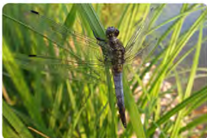
Orthetrum , orthétrum réticulé